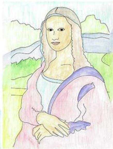
Леонардо да Винчи «Мона Лиза» - Акварель. рис 6

Техника - Акварель, гуашь, цветные карандаши