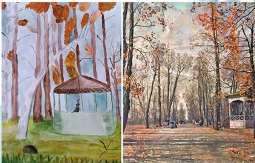
Исаак Бродский «Летний сад осенью» - Акварель. рис 10