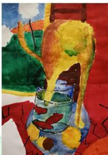
Творческая работа «Улыбка Матисса» - Гуашь. рис 7