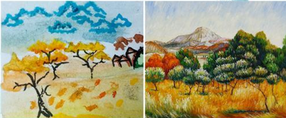
Пьер Огюст Ренуар «Гора Сент - Виктуар» - Пастель. рис 9