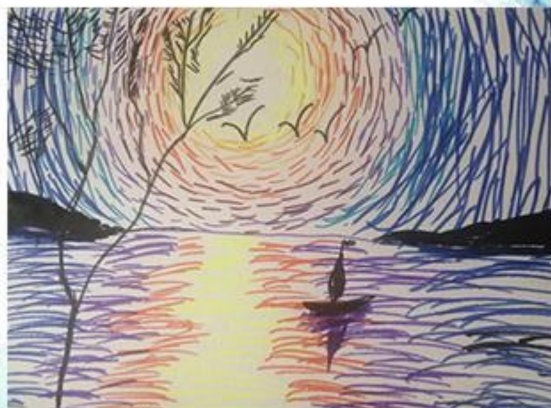
Клод Моне «Закат над морем» - Графика. рис 8