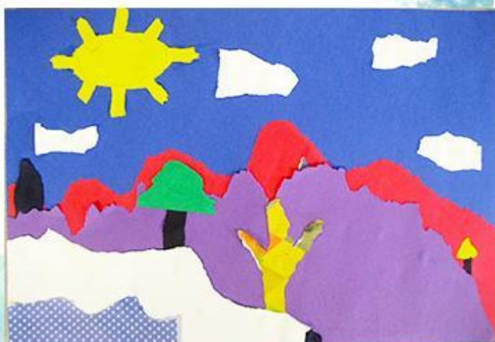
Николай Рерих- «Горы» - Бумагопластика. рис 14