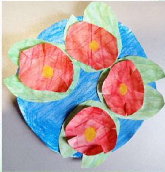
Клод Моне - «Кувшинки» - Аппликация. рис 3