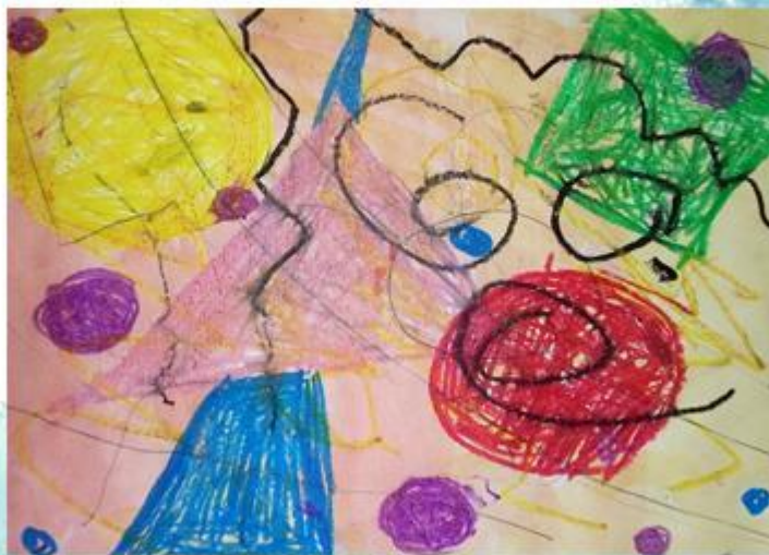
Василий Кандинский - «Абстракционизм» - Монотипия. рис 4