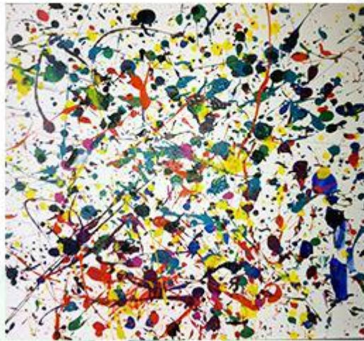
Джексон Поллок - Набрызг. рис 5