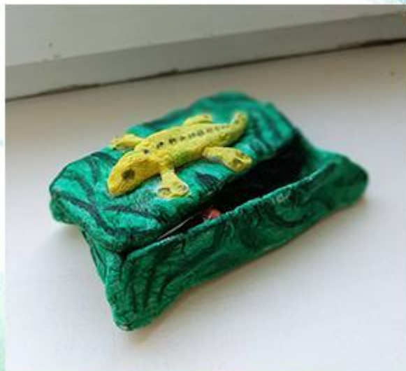
«Малахитовая шкатулка» - Соленое тесто. рис 11