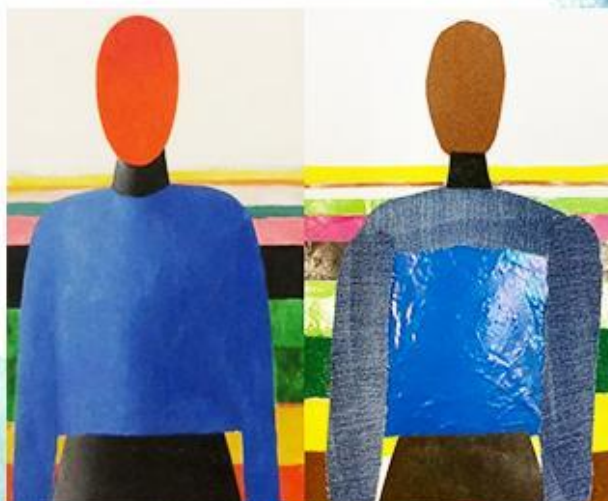
Казимир Малевич- «Спортсмены» - Аппликация. рис 13