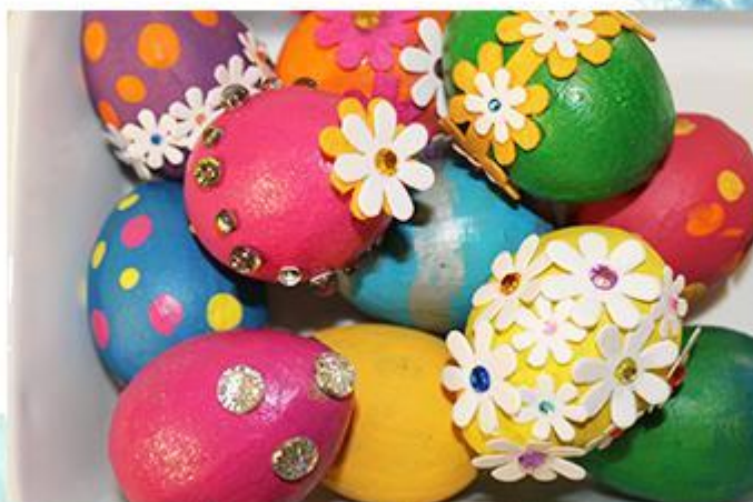
«Яйца Фаберже к Пасхе» - рис 12