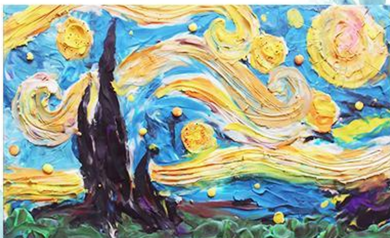
Винсент Ван Гог - «Звездная ночь» - Пластилинография. рис 1